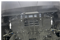
Рис. 1 - Установка фиксируемых гаек