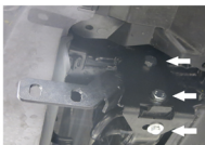
Рис. 2 - Установка кронштейнов