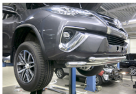
Рис. 4 - Общий вид автомобиля с защитой