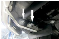
Рис. 3 - Установка защиты