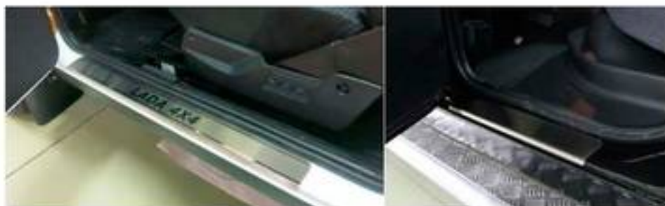
Фото установленных накладок

Накладки на остальные пороги устанавливаются аналогичным образом.