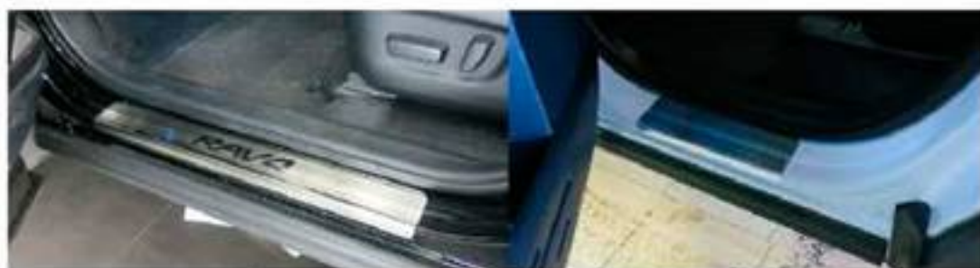
Фото установленных накладок

Накладки на остальные пороги устанавливаются аналогичным образом.