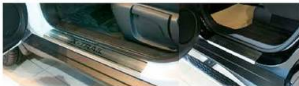
Фото установленных накладок

Накладки на остальные пороги устанавливаются аналогичным образом.