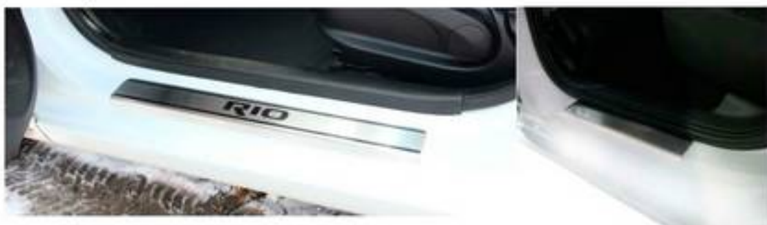
Фото установленных накладок