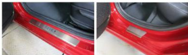
Фото установленных накладок