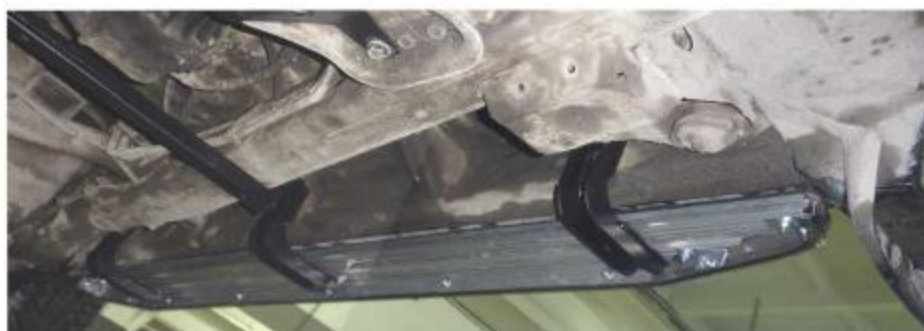
Рис. 4 Вид установленных кронштейнов