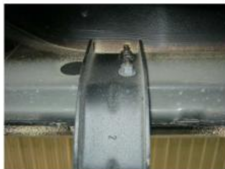
Рис. 3 Установка кронштейна