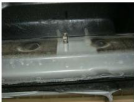
Рис. 2 Место крепления