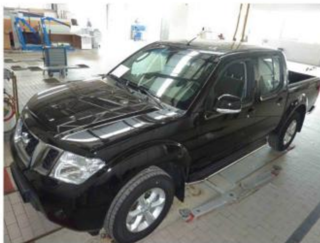
Рис. 5 Вид автомобиля с порогом