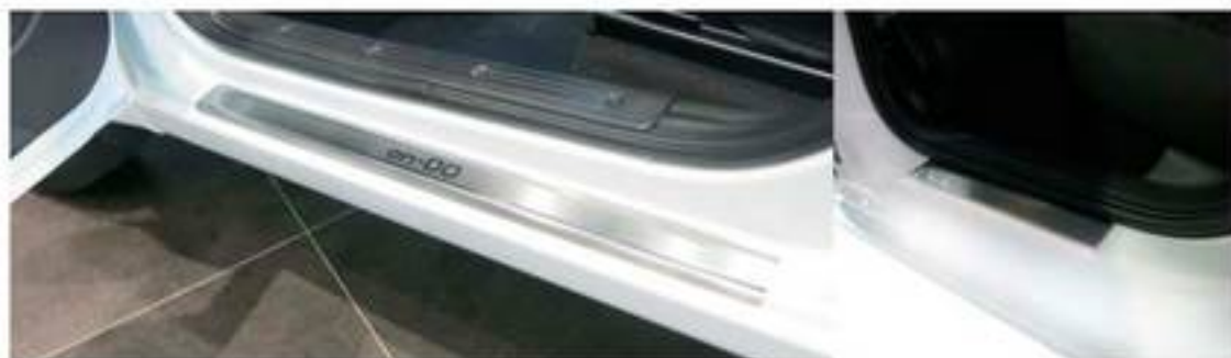
Фото установленных накладок

Накладки на остальные пороги устанавливается аналогичным образом.