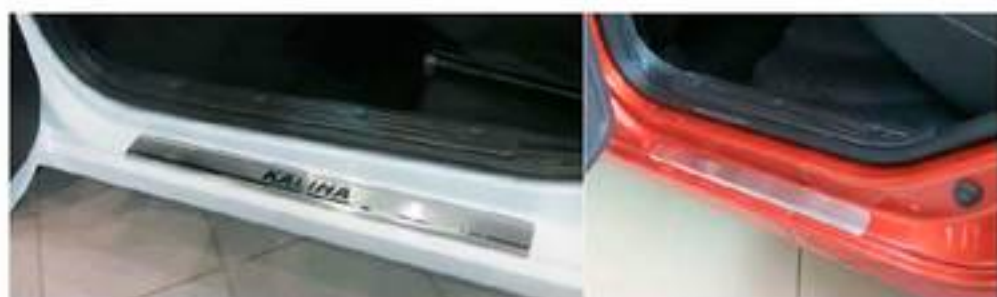
Фото установленных накладок

Накладки на остальные пороги устанавливаются аналогичным образом.