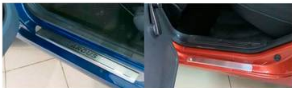
Фото установленных накладок

Накладки на остальные пороги устанавливаются аналогичным образом.