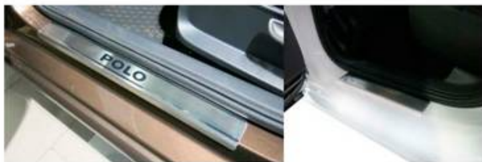
Фото установленных накладок

Накладки на остальные пороги устанавливаются аналогичным образом.