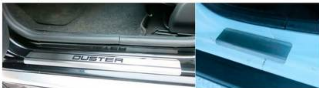
Фото установленных накладок

Накладки на остальные пороги устанавливаются аналогичным образом.