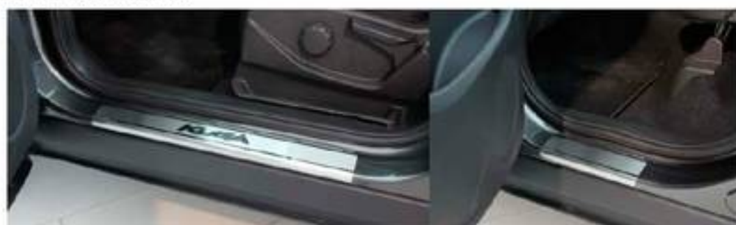
Фото установленных накладок

Накладки на остальные пороги устанавливаются аналогичным образом.