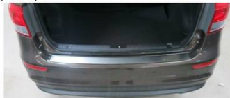
Фото установленной наклейки