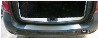
Фото установленной накладки