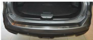
Фото установленной наклейки