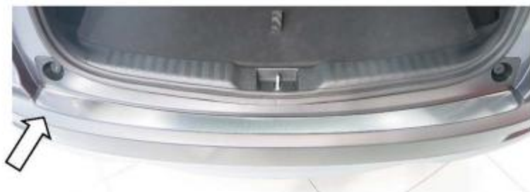
Фото установленной наклейки